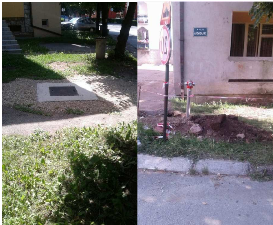
Nakon završetka radova Rekonstrukcija vodovoda u ul. Omladinskoj I Tanasija Pejatovića