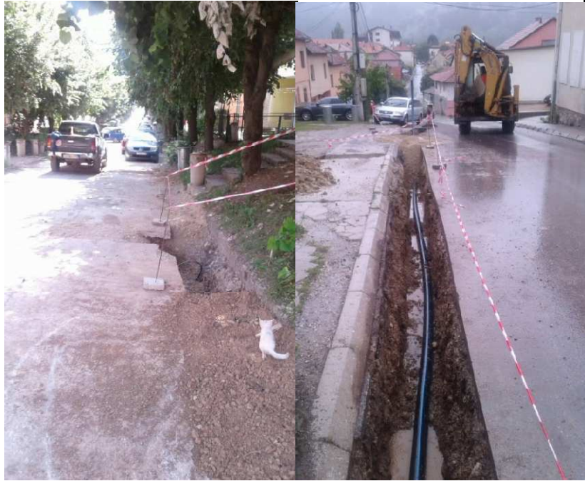
U toku izvođenja radova