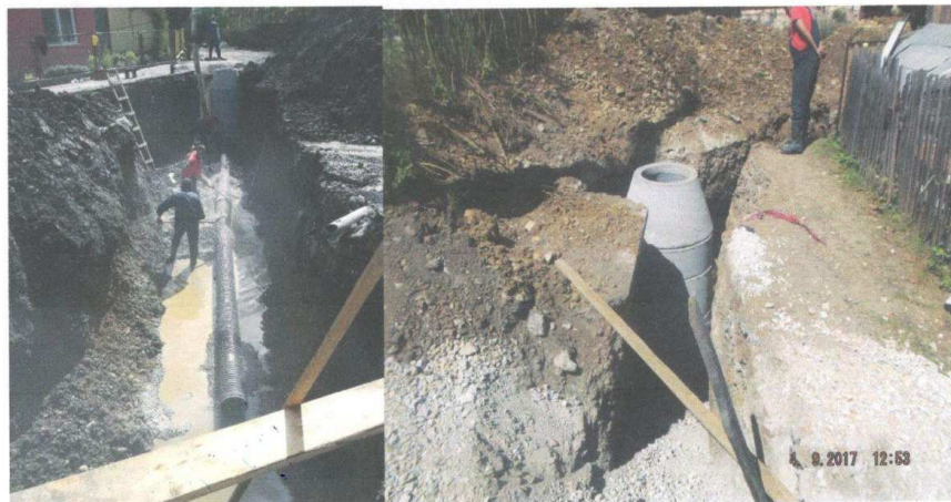
Slika br. 3. Izgled trase u toku izvođenja radova