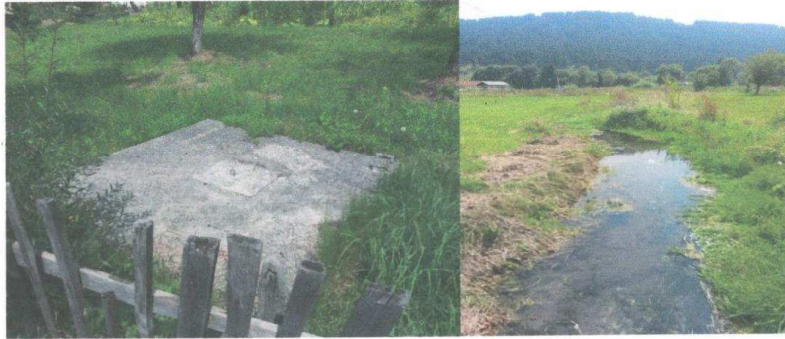
Slika br. 2. Stanje kanalizacije u Ševarima prije početka radova

PRVA: 535-10504-92 NLB: 530-14722-79 ATLAS: 505-8407-70 CKB: 510-11466-77 PIB: 02343762 PDV: 50/31-00339-5