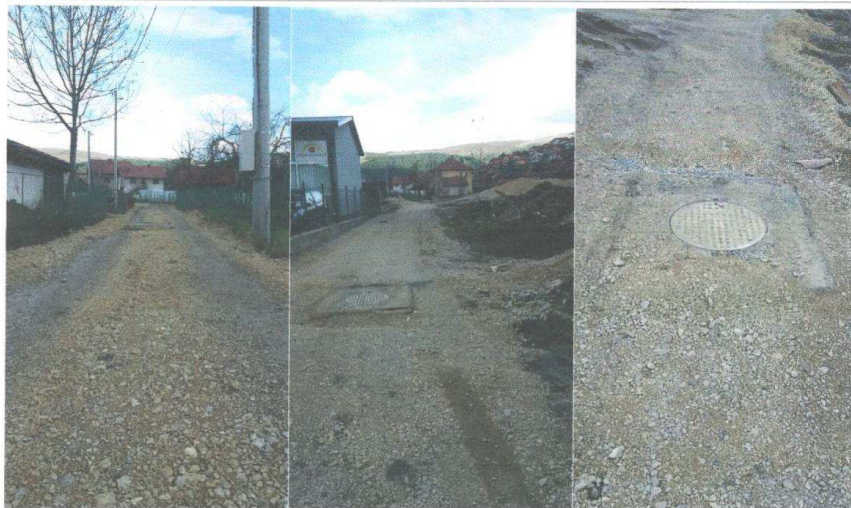
Slika br. 4. Naselje Ševari nakon završenih radova

PRVA: 535-10504-92 NLB: 530-14722-79 ATLAS: 505-8407-70 CKB: 510-11466-77 PIB: 02343762 PDV: 50/31-00339-5